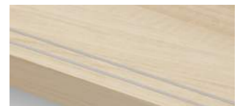
イタリアンウォルナット