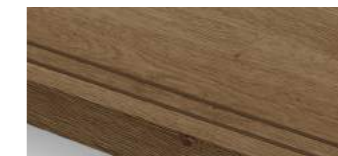
ナチュラルオーク