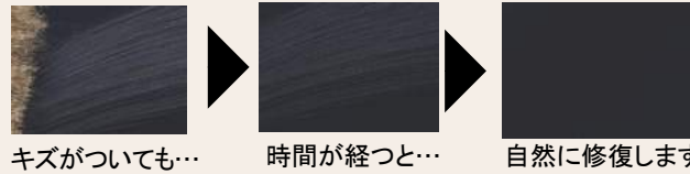
キズがついても... 時間が経つと... 自然に修復します

※室外側ハンドルのみ対応しております。 ※鍵や硬貨などで引っかいたキズのように、塗装がはがれるような深いキズは修復しません。 ※周囲の温度状況やキズの深さによって、修復時間は異なります。気温が低いほど修復時間が長くなります。