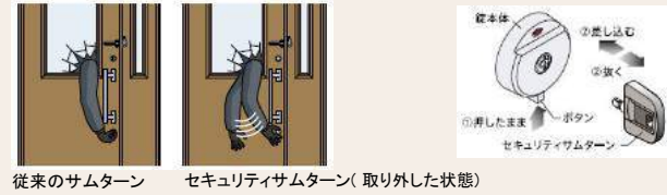
従来のサムターン セキュリティサムターン(取り外した状態)

ボタンを押すだけで、サムターンの取り外しが可能。外出時や就寝時に外しておけば、万が一ドアや窓ガラスに穴をあけられても、「サムターン回し」で開けられる心配がありません。